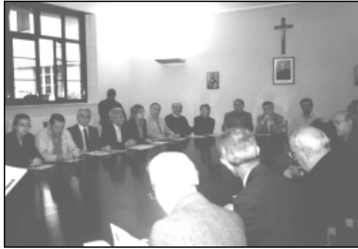
Un momento del convegno del 2001

Al convegno sono ovviamente invitati dirigenti ed iscritti che si spera siano presenti in gran numero, stante l'attuale difficile situazione politico-sociale.