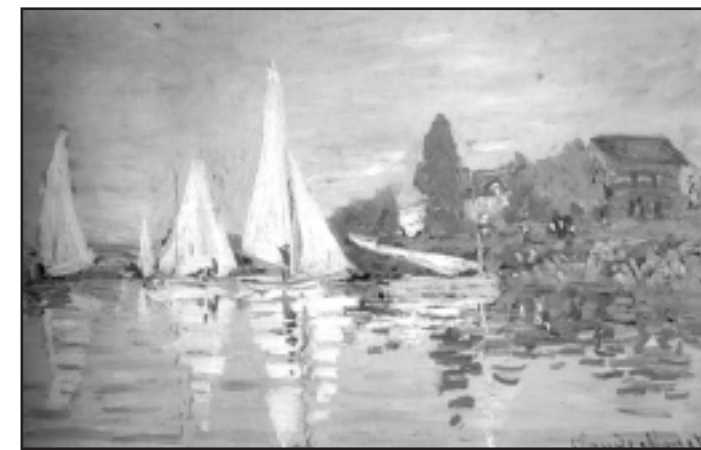
Claude Monet: Regate ad Argenteuil Parigi - Museo d'Orsay

L'Mcl organizzerà una gita a Brescia a fine febbraio per visitare la mostra; chi è intenzionato a partecipare deve fin da ora prenotarsi presso la segreteria per poter riservarsi il biglietto